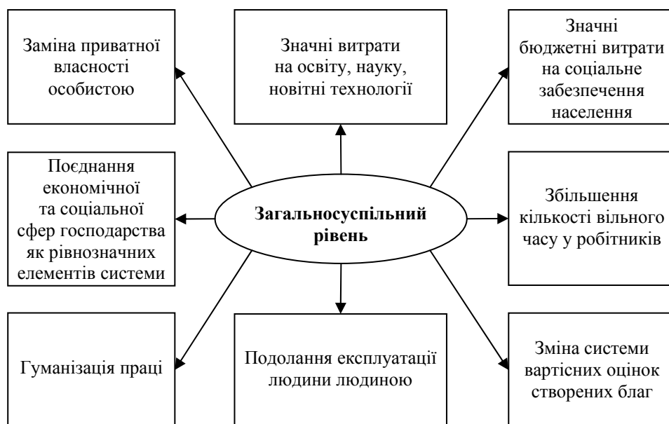
Рис. 1. Основні ознаки постіндустріального суспільства на загальносуспільному рівні

новацій. Зокрема Швейцарія, що посіла перше місце за складовою "Фактори інновацій та розвитку" (ранг 5.79), Швеція – 2 місце (ранг 5.79), Фінляндія – 4 місце (ранг 5.56). Винятком є тільки Сінгапур, який за цією складовою посів 11 місце (ранг – 5.23), але має суттєві здобутки в інших сферах [9].