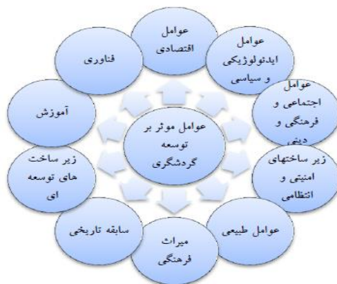
تصویر ۲. عوامل مؤثر بر توسعه گردشگری

در تقسیم‌بندی دیگر، عوامل مؤثر بر توسعه گردشگری عبارت‌اند از: ۱. عوامل اقتصادی؛ ۲. عوامل ایدئولوژیک، سیاسی، و روابط بین‌المللی؛ ۳. عوامل اجتماعی، فرهنگی، و دینی؛ ۴. زیرساخت‌های امنیتی و انتظامی؛ ۵. عوامل طبیعی؛ ۶. میراث فرهنگی؛ ۷. سابقه تاریخی؛ ۸. زیرساخت‌های توسعه‌ای؛ ۹. آموزش؛ ۱۰. فناوری (Tribe 1997).