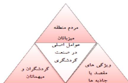
تصویر ۱. عوامل اصلی در توسعه صنعت گردشگری

هماهنگی بین بخش‌های دولتی و خصوصی حائز اهمیت است (تقوایی و همکاران ۱۳۹۱: ۲۹). عوامل متعددی در توسعه صنعت گردشگری در یک منطقه نقش دارند که ارتباط و توسعه بین آن‌ها توسعه گردشگری را شکل می‌دهد. در این ارتباط، سه عامل اصلی در توسعه گردشگری عبارت‌اند از: گردشگران، جامعه میزبان، و ویژگی‌های مقصد (جاذبه‌ها) (محرابی و همکاران ۱۳۹۱: ۴).